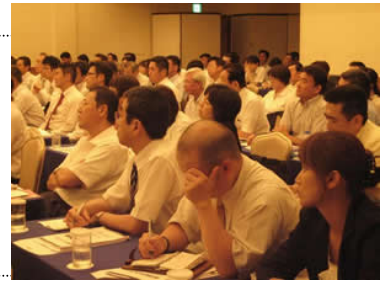
前回の「採用セミナー」の様子

今回のザメディアジョン主催経営者セミナーは、ピンチを救う【キャリア採用】と、会社の体制を根底から変える【新卒採用】、両面からお話します！ 「個人のモチベーションを共有し、力を発揮させるには！？」 「会社のピンチを支えた番頭さん採用のノウハウ」 「社長～役員～一般社員を革新的に変える【串刺し新卒採用】の秘密」 など事例を交えながらお話します！